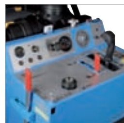
Benutzerfreundliche Bedien- elemente erleichtern die Handhabung und Arbeits- überwachung