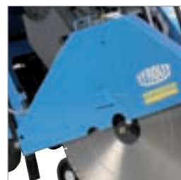
Praktischer Universal-Blatt- schutz ermöglicht neben Links- und Rechtsschnittfunktion auch Eck-Bündigschnitte