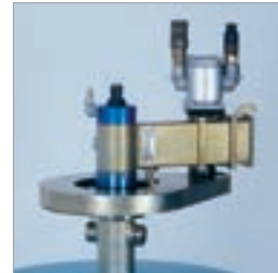
Untersetzungsausleger ermöglichen Bohrungen bis Durchmesser 1000 mm