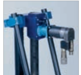
Wirkungsvolles Bohren mittels hydraulischen Vorschubs