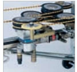
Durchdachter Seilspender mit Anpressrolle