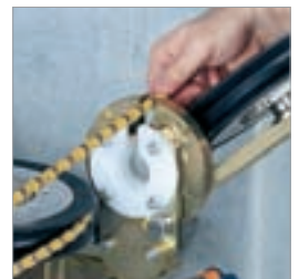
Seil lässt sich geschlossen in die Maschine legen