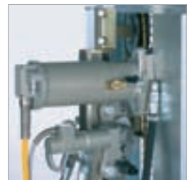
Haupt- und Vorschubmotor