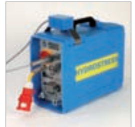
Steuerung für 16 und 32 A Betrieb. Leicht und einfach zu transportieren – nur 19,5 kg Gewicht