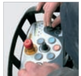
Sämtliche Funktionen sind über die Fernbedienung steuerbar