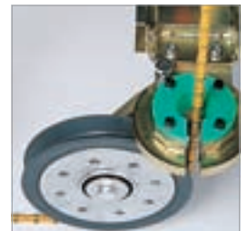
Seil lässt sich geschlossen in die Maschine legen

Standardmäßig geeignet für Baukörper bis zu 7,4 m Umfang dank großem Seilspeicher