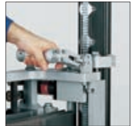
Schnelle Montage auf Tyrolit Hydrostress Standardschienen