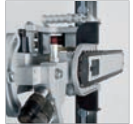
Wandbündigschneiden und überschnittlose Ecken