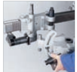
Einfaches Handling dank Schnelltrennebene