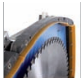
Systemblattschutz für Bündig- und Normalschnitt