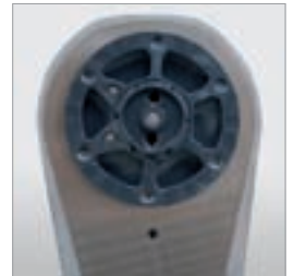
Kompakter Sägekopf mit Riemenschwenkarm