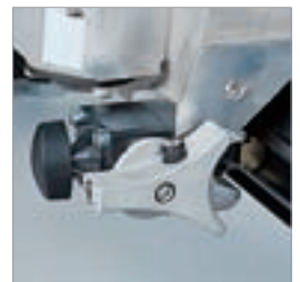
Gleitführung mit ergono- mischem Verschluss-System und Feineinstellung