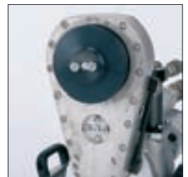
Getriebeschwenkarm mit Schnelltrennflansch für einfachen Blattwechsel