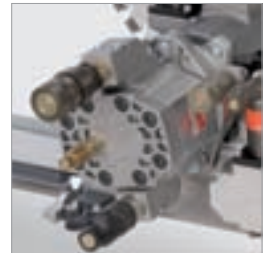
Hauptmotor mit Leckölanschluss