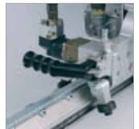
Wandsägekopf lässt sich schnell und einfach montieren