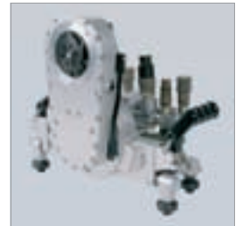
Wandsägekopf aus hochfester Aluminiumlegierung, Zahnrad-schwenkarm und Rollenführungen