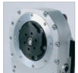
Getriebeschwenkarm mit Schnelltrennflansch-Aufnahme